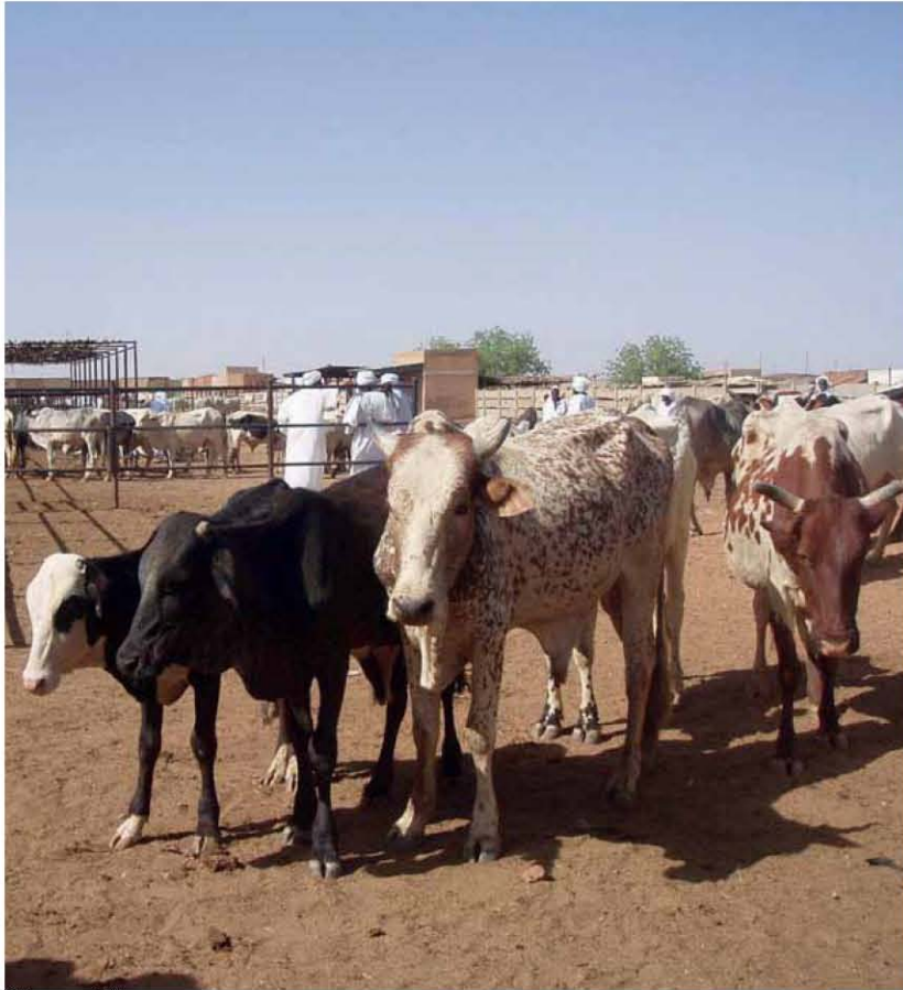
بعض المواشي بسوق نيالا