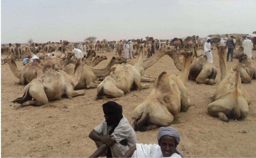
سوق الجمال بسرف عمرة