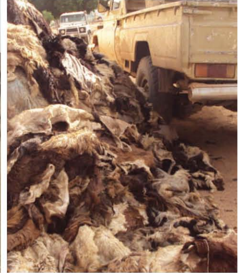
هنالك تجارة متنامية في دارفور في الجلود

تم الدخول في إتفاقيات تجارية في بعض المواقع مثل سرف عمرة بين التجار الذين لهم إرتباطات - بخلاف هذه الإتفاقيات - مع المجموعات المتمردة. ربما تمثل هذه التعاملات الأساس للعمل المستقبلي لبناء السلام وذلك بفرض إعادة بناء العلاقات بين هذه المجموعات بمنظور طويل الأمد. وكمثال لذلك هل من الممكن أن تمثل هذه المجموعات أيضاً أساساً ليحث مسألة الإدارة المشتركة المستدامة والسلمية للموارد الطبيعية التي تشمل مجموعات سبل كسب عيش مختلفة بالإضافة إلى الترويج لحركة تجارة تسم بحريات أكبر.